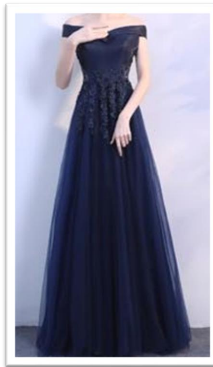
イブニングドレス 夜の正礼装