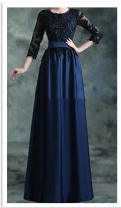
アフタヌンドレス 昼の正礼装