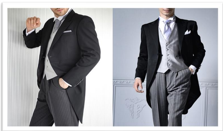
モーニングコート昼の正礼装