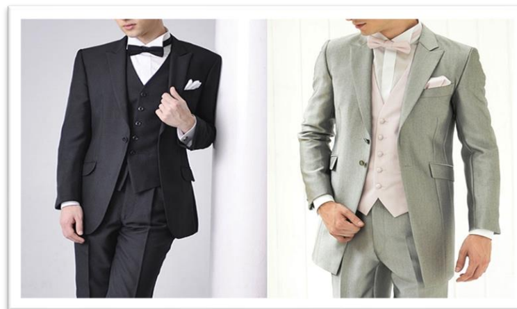
テイルコート（燕尾服） タキシード夜の正礼装